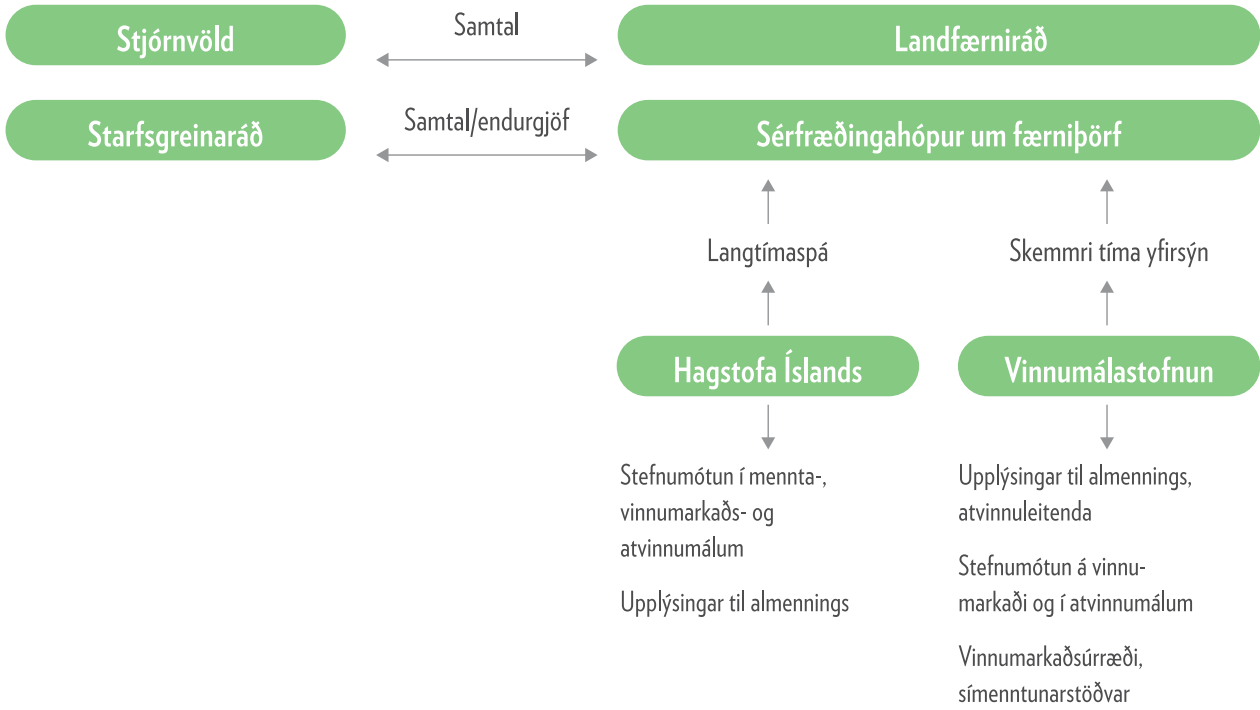
Mynd 3. Íslenskt spáferli