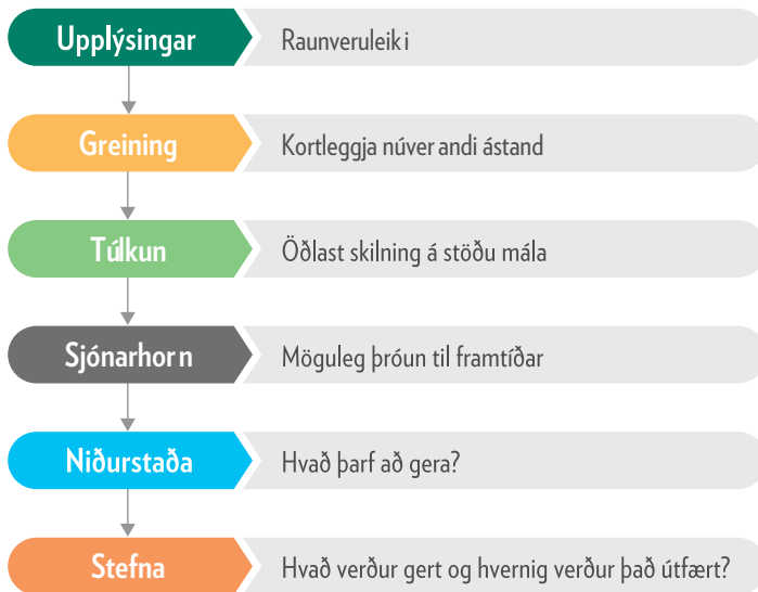
Mynd 1. Framsýniferlið

Framsýniaðferðum má skipta í þrjú flokka, leitandi aðferðir (e. Exploratory methods), skilyrtar aðferðir (e. Normative methods) og stuðningsaðferðir (e. Supplementary methods). Þær tvær síðari eru þó í raun ekki framsýniaðferðir en eru notaðar til stuðnings þeim.